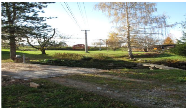
An der Stelle des Strommastes stand das Geburtshaus von Wenzel Jaksch Thomas Oellermann

Zu Beginn des 14. Jahrhunderts bekam der Ort Stadtrecht und ein eigenes Wappen. Ab 1620 unterstand Strobnitz dem habsburgischen Feldherrn Charles Bonaventure de Longueval, Comte de Bucquoy. In der Folge entwickelten sich vor allem Webereien. Die Stadt litt aber an der großen Entfernung zur Eisenbahn. Trotzdem entwickelte sie sich weiter. Es entstanden eine Sparkasse, eine Post, kleinere Fabriken. 1888 wurde eine wichtige Fabrik für landwirtschaftliche Maschinen gegründet. Und dann erblickte im Vorort Langstrobnitz, einem langen Straßendorf, am 25. September 1896 Wenzel Jaksch das Licht der Welt. Sein Geburtshaus, das durch wenige Fotografien belegt ist, steht heute nicht mehr. Und auch im heutigen Horní Stropnice sucht man vergeblich nach einem Hinweis auf den wohl bekanntesten Sohn der Stadt. Was bleibt, ist ein Besuch vor Ort und das Gefühl für dieses kleine böhmische Dorf, in das Wenzel Jaksch im September 1896 hineingeboren wurde.